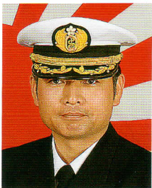
あさぎり艦長 2等海佐 川内 健治

主要兵装 62口径76ミリ速射砲×1 高性能20ミリ機関砲(CIWS)×2 対艦ミサイル発射装置×1 対空ミサイル発射装置×1 対潜ロケット発射装置×1 3連装短魚雷発射管×2 哨戒ヘリコプターSH-60J×1